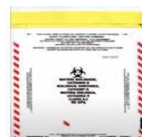
② - Le flacon dans le sachet épais 95kPa avec buvard - Fermeture du sachet

⚠ PAS de fiche à l'intérieur du sachet !